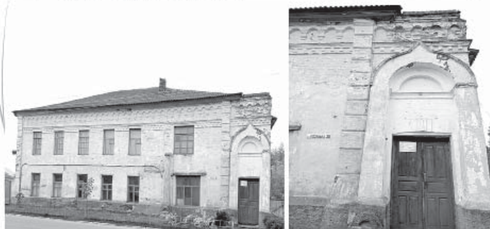
Будівля першої молитовної школи (вулиця Козацька)

кількість скарг, губернське правління зобов'язало повітового справника провести детальне розслідування та з'ясувати, чи мали місце незаконні вчинки на посаді. Слідство тривало 10 місяців. В результаті були спростовані всі обвинувачення на адресу рабина.