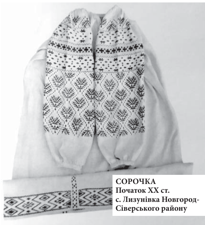
СОРОЧКА Початок ХХ ст. с. Лизунівка Новгород-Сіверського району

Або: «Пусти, сваточку, в хаточку. Ми сядемо в запічку. Дасиш чарочку –