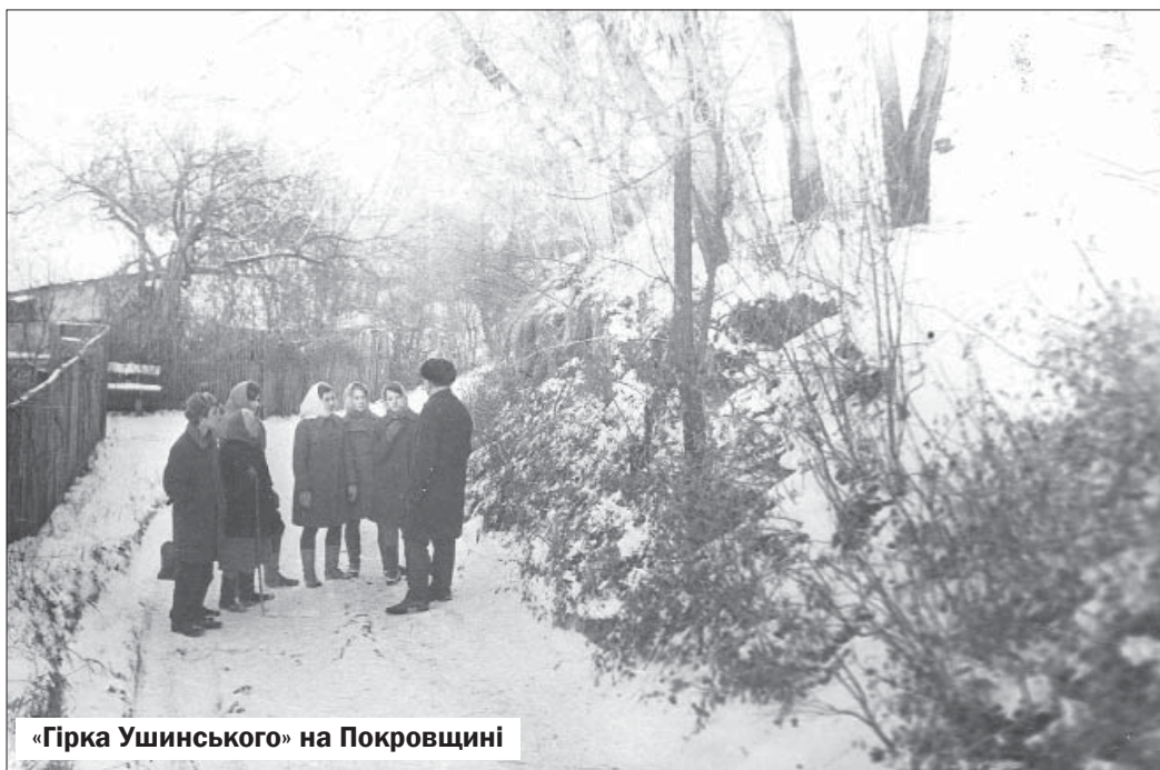
«Гірка Ушинського» на Покровщині

Гімназія залишила в пам'яті К. Ушинського дуже глибокий слід, це він зрозумів значно пізніше, коли вже вченим зіткнувся зі звичаями та порядками, які панували в столичних гімназіях. В 1859 році Костянтин Дмитрович в черговий раз відвідав Новгород-Сіверський, побував у новому приміщенні гімназії, збудованому в 1844 році,